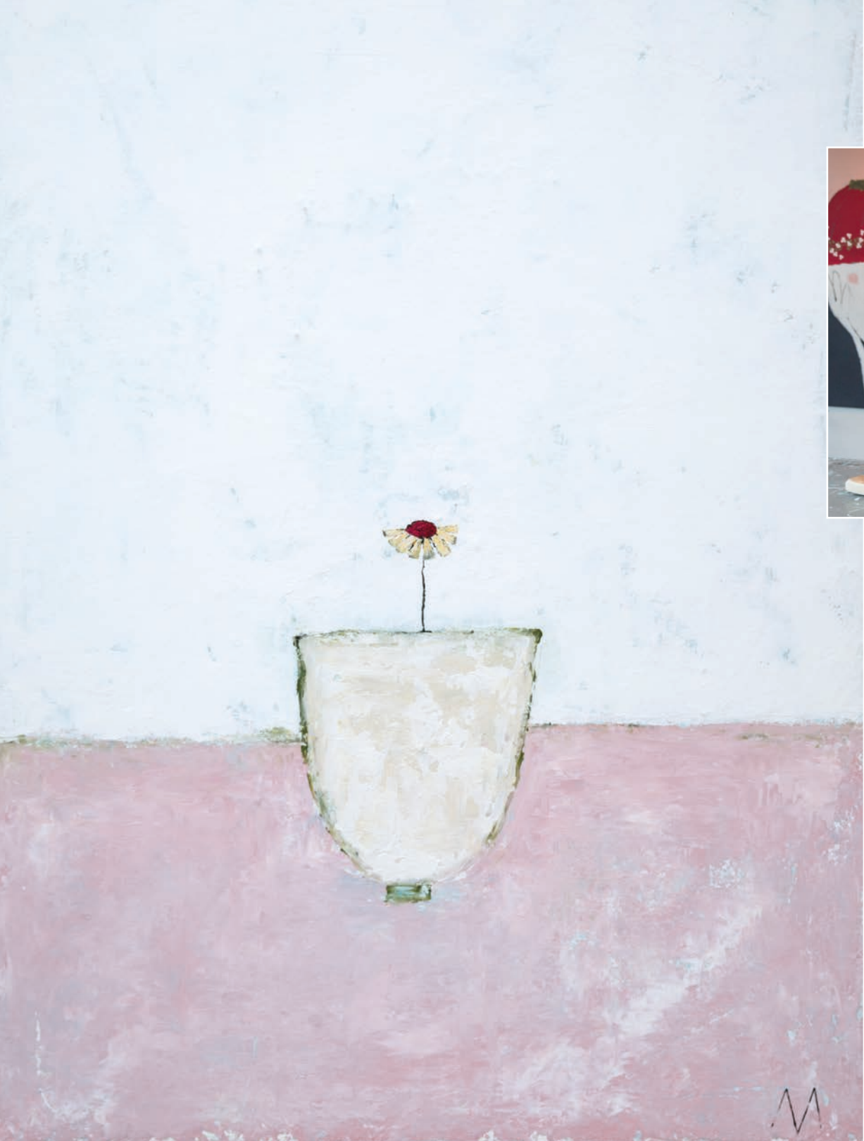
"Livets gang .."