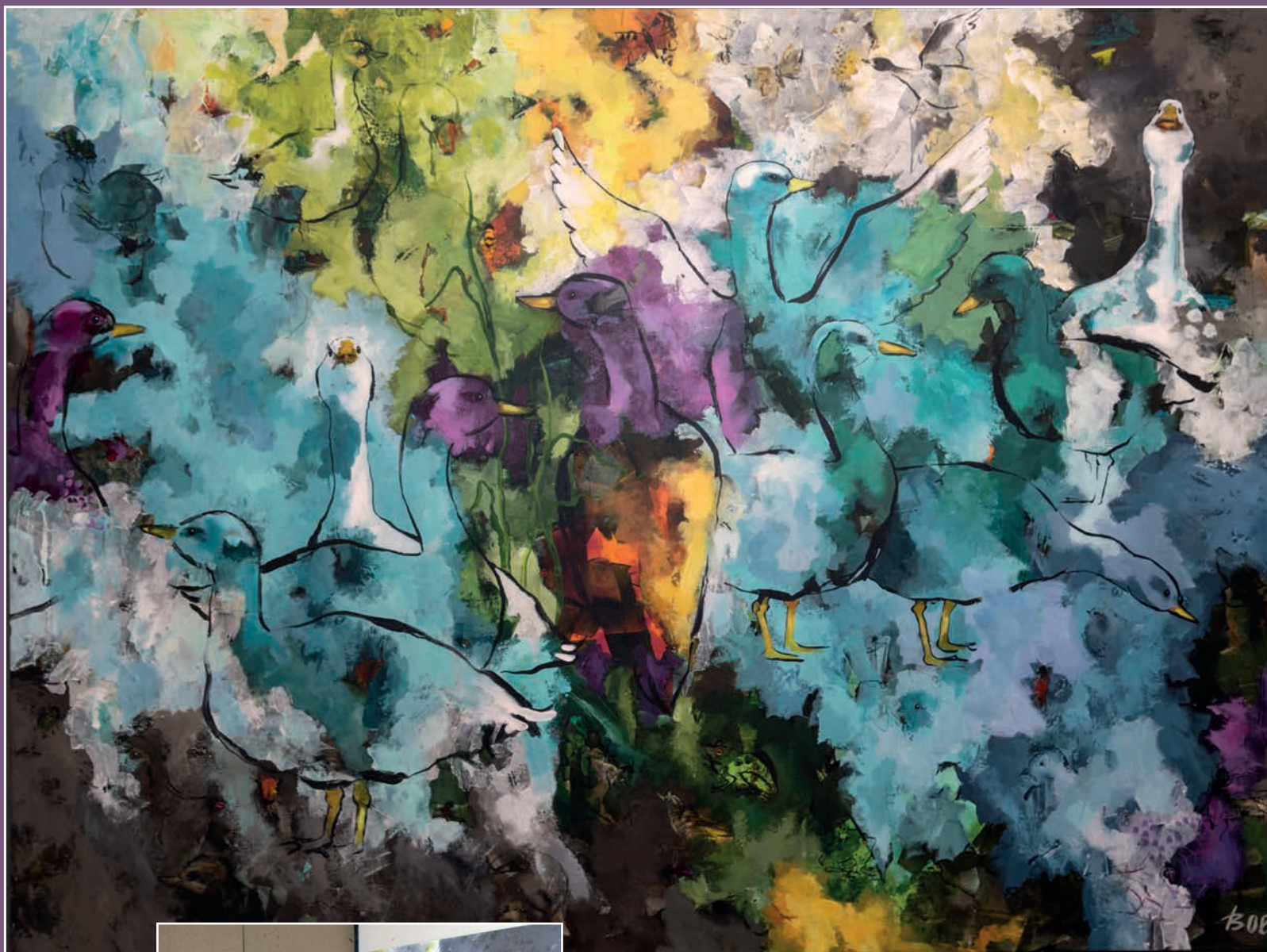
Gæs ved Spøttrup Sø