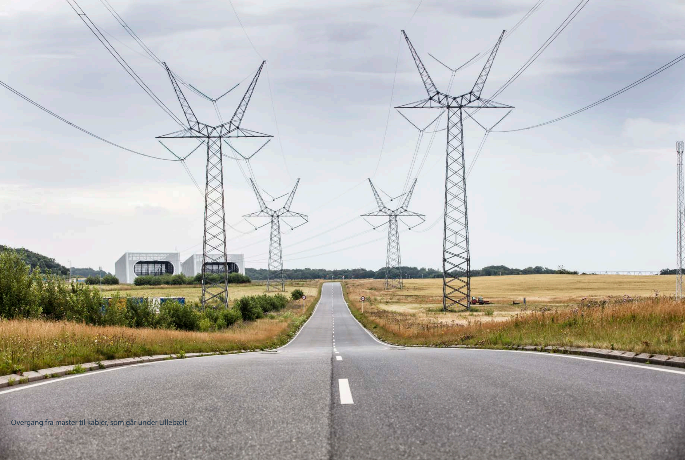
Overgang fra master til kabler, som går under Lillebælt

"Jeg tror, at det med at føle sig ældre eller gammel handler om energi. Energien er alfa og omega. I det øjeblik, du føler, at den svækkes, begynder du at føle dig svækket. Indtil da er man jo den samme." Energi og livsmod: Citat fra Anne Linnets bog "Livsmodig"