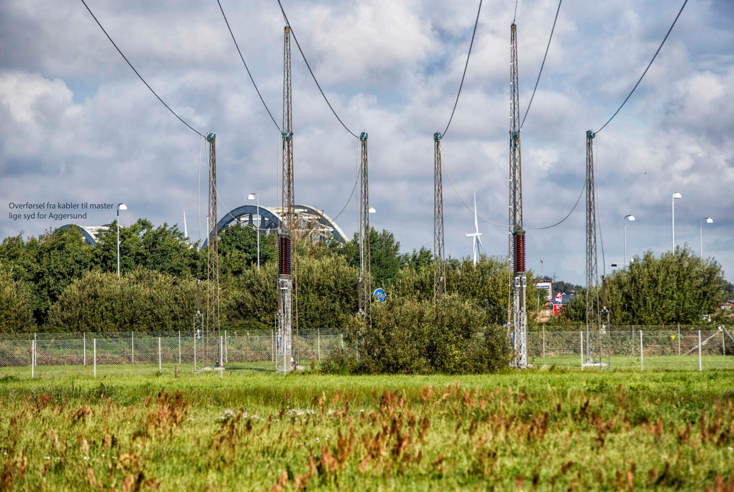
Overførsel fra kabler til master lige syd for Aggersund